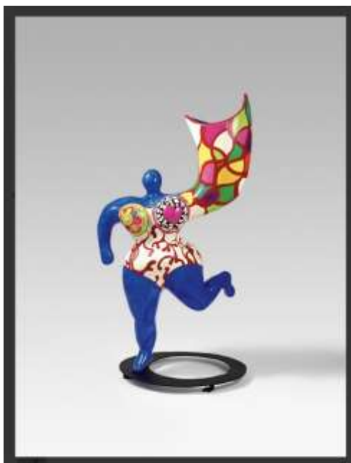
Figure absolue de la femme artiste, Niki de Saint Phalle a marqué le 20ème siècle par son œuvre et sa personnalité. De son vrai nom Catherine-Marie-Agnes Fal de Saint Phalle, elle est née en 1930 en France, à Neuilly-sur-Seine, et décéda 72 ans plus tard, en 2002, sur la côte californienne.

C'est lors d'un sombre épisode de sa vie que Niki de Saint Phalle découvre sa passion pour la peinture. Après une carrière de mannequin, elle souffre dès l'âge de 22 ans d'une dépression. L'art thérapie va se révéler salutaire pour la jeune femme et lui permettre de dissiper son mal. Il n'est pas étonnant que l'artiste en devenir trouve très vite écho auprès de l'art brut, initié par Jean Dubuffet, ou de l'art outsider. Autodidacte, Niki de Saint Phalle commence à peindre dans les années 1952, marquant ainsi les premiers pas d'une artiste aux multiples talents.